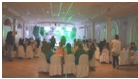
Alegre festejo a madres radioescuchas de La Sonora de Nogales