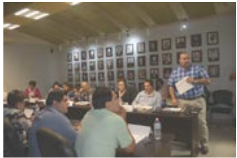
Ayuntamiento de Cajeme

Índigo. Un azul descolorido. Diputados quieren prohibir los tatuajes porque "distorsionan la conducta". Señala de que algunas legislaciones representan pasos en retroceso en materia de igualdad y derechos humanos, dos diputados panistas arremetieron la pretérita semana en contra de los tatuajes pues contribuyen "al deterioro de los valores de la sociedad" y es "inconcebible" que existan muchos niños y jóvenes que tengan el gusto y "padecimiento de exhibir los tatuajes", a pesar de las consecuencias sociales, familiares,